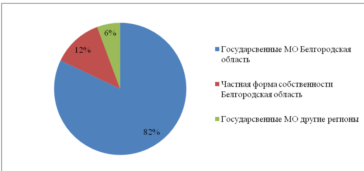
Рис. 8.3. Структура трудоустройства в разрезе регионов и форм собственности МО.

По данным предварительного трудоустройства выпускников 2022 года по востребованным специальностям следует вывод, что 54,6% выпускников выбрали первым местом работы государственные больницы Белгородской области.